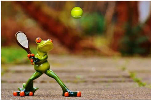
Spiel und Spaß für die Minis

Seit Gründung der Tennisschule hat Jens Rahr viel Zeit in die Entwicklung eines Trainingssystem für 3-6-Jährige investiert. Das kindgerechte Konzept und die immer weiter entwickelten Materialien für die Minis und Teens erleichtert die Hinführung zum Tennis und die schnelle Entwicklung bis hin zum Profi.