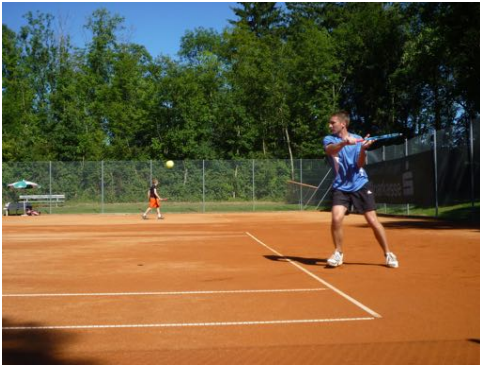
Sportliches Vergnügen für jede Zielgruppe