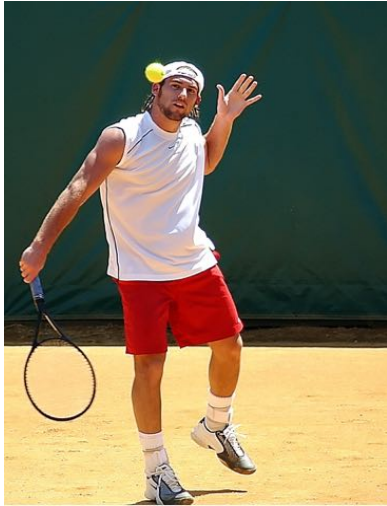
Professionelles und individuelles Training in jeder Leistungsklasse

Ziel des Tennistrainings ist die Herstellung der optimalen Handlungsfähigkeit des Spielers im Tennisspiel.