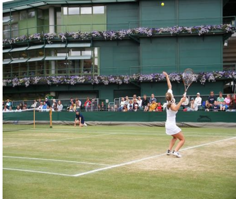
Leistungstennis für jede Altersklasse